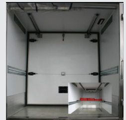
Trennwand Vario Lite® leicht und variabel, auch als Zwischenboden für Partyservice nutzbar