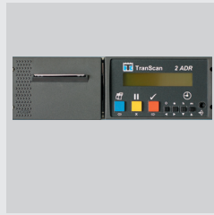
Temperaturschreiber mit Drucker