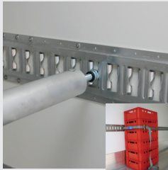
Ladungssicherung: Ankerschiene mit Absperrstange oder Zurring