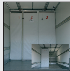
Cool Slide - Trennwand für Transporte in mehreren Temperaturbereichen