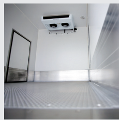
flüssigkeitsdichte Bodenwanne aus Aluminium-Gerstenkorn