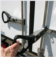
Edelstahlverschluss, ergonomischer Griff, Einhandbedienung