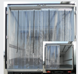
PVC-Kältevorhang, zweiteilt, verschiebbar