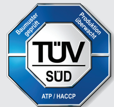
HACCP-geprüft - hygienischer Transport