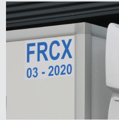
ATP-FRC - Zertifikat und Beschriftung